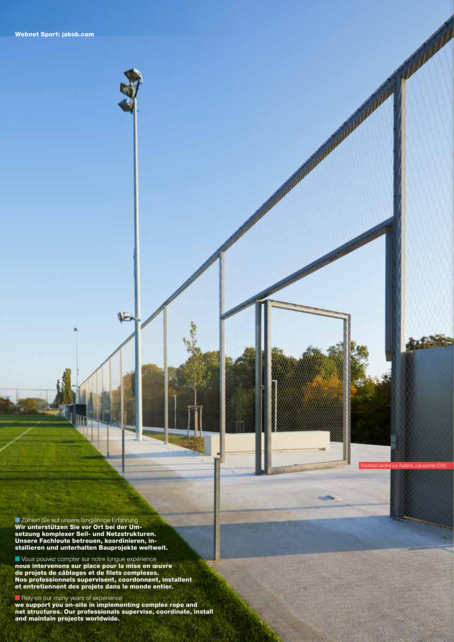
Football centre La Tuilière, Lausanne (CH)