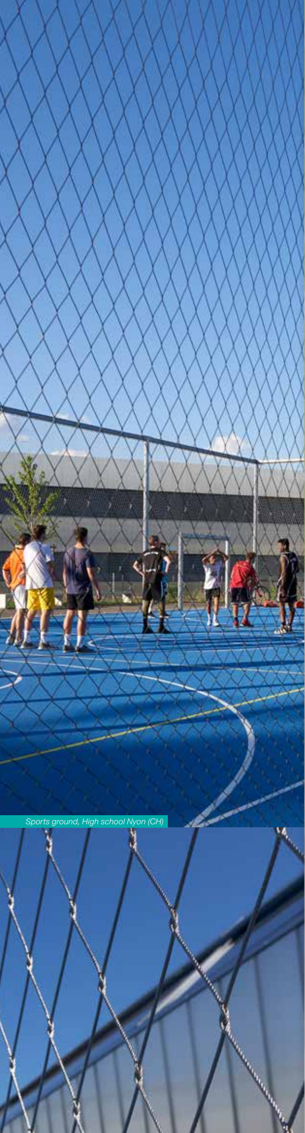
Sports ground, High school Nyon (CH)