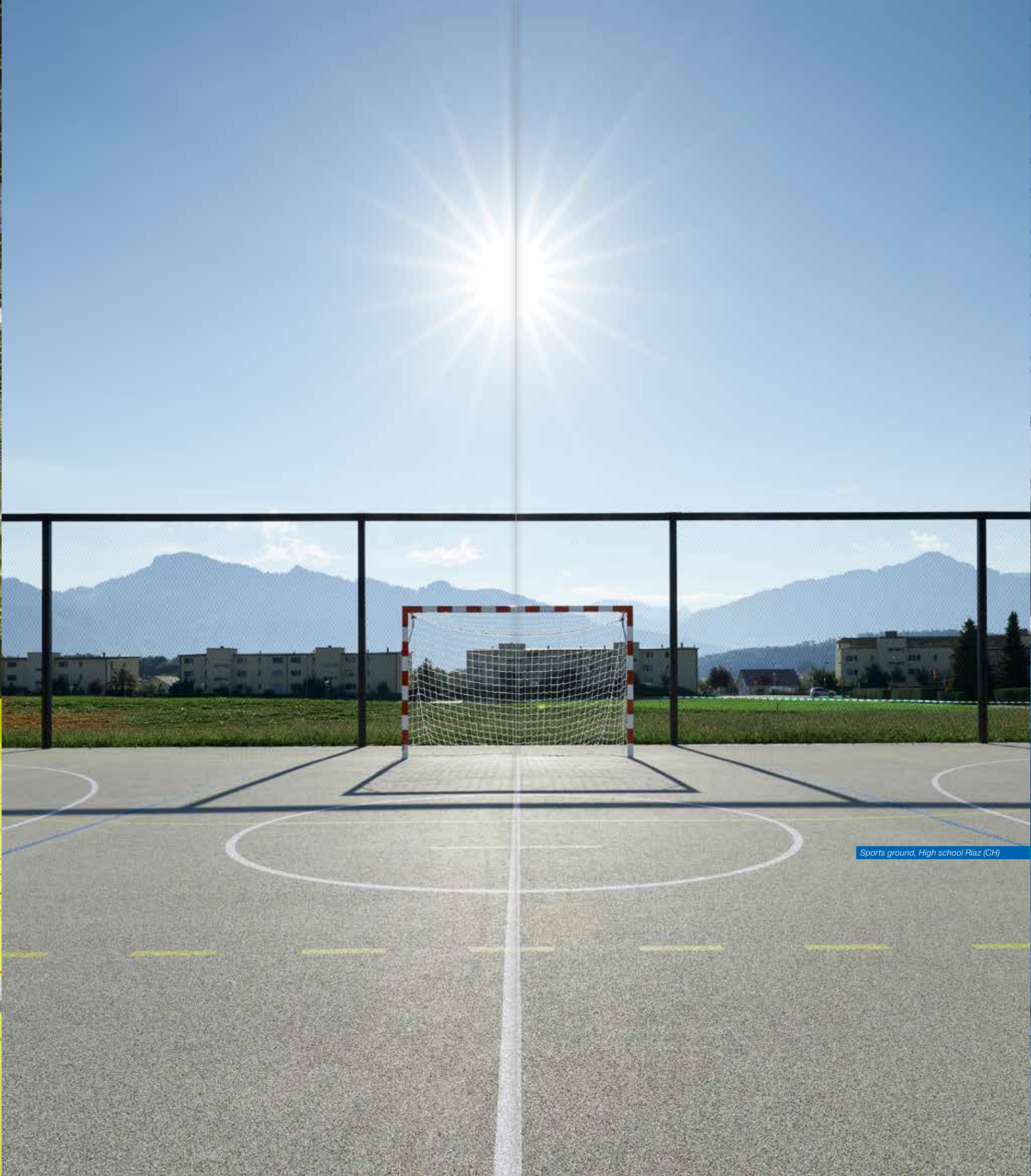
Sports ground, High school Riaz (CH)