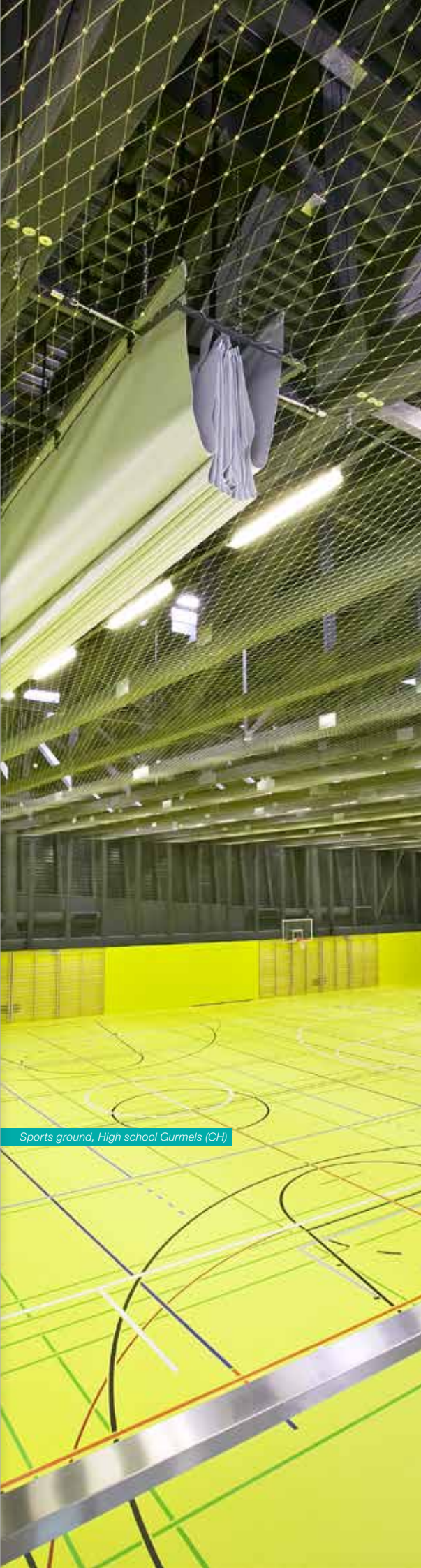
Sports ground, High school Gurmels (CH)