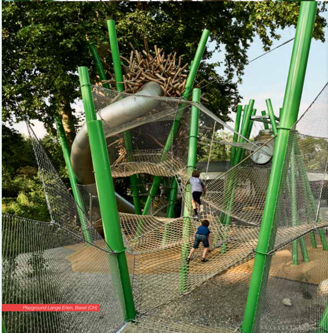
Playground Lange Erlen, Basel (CH)

■ Webnet von Jakob® Rope Systems lässt sich als Fläche oder dreidimensionale Form spannen. Dem Einsatz dieser transparenten Netzstruktur aus Inox-Seilen sind keine Grenzen gesetzt.